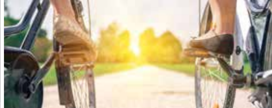
N-VA pleit voor fiets- en wandelbrug over de Vaart (p. 2-3)