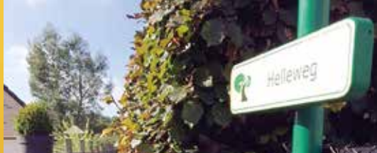
N-VA verzet zich tegen afschaffing trage wegen (p. 2)